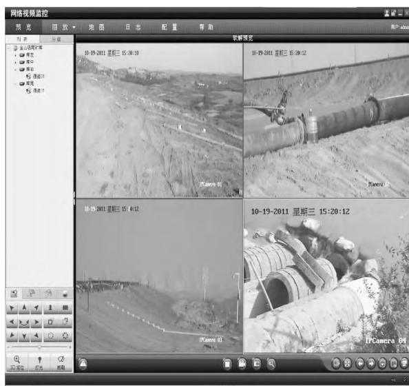
图 10 视频全图